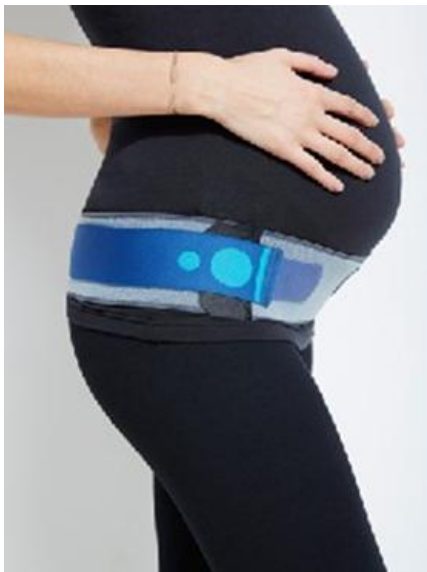
Image extraite du mode d'emploi ceintures Physiomat