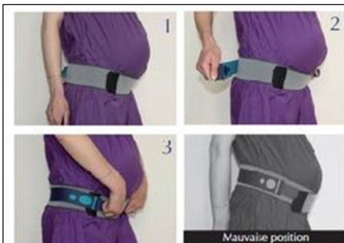
Image extraite du mode d'emploi ceintures Physiomat

La ceinture se pose sur des vêtements collant au corps ou entre les survêtements et les vêtements.