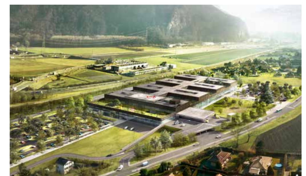
Images de synthèse du futur hôpital de soins aigus à Rennaz qui ouvrira ses portes en 2018 et aperçu de l'une de ses chambres.