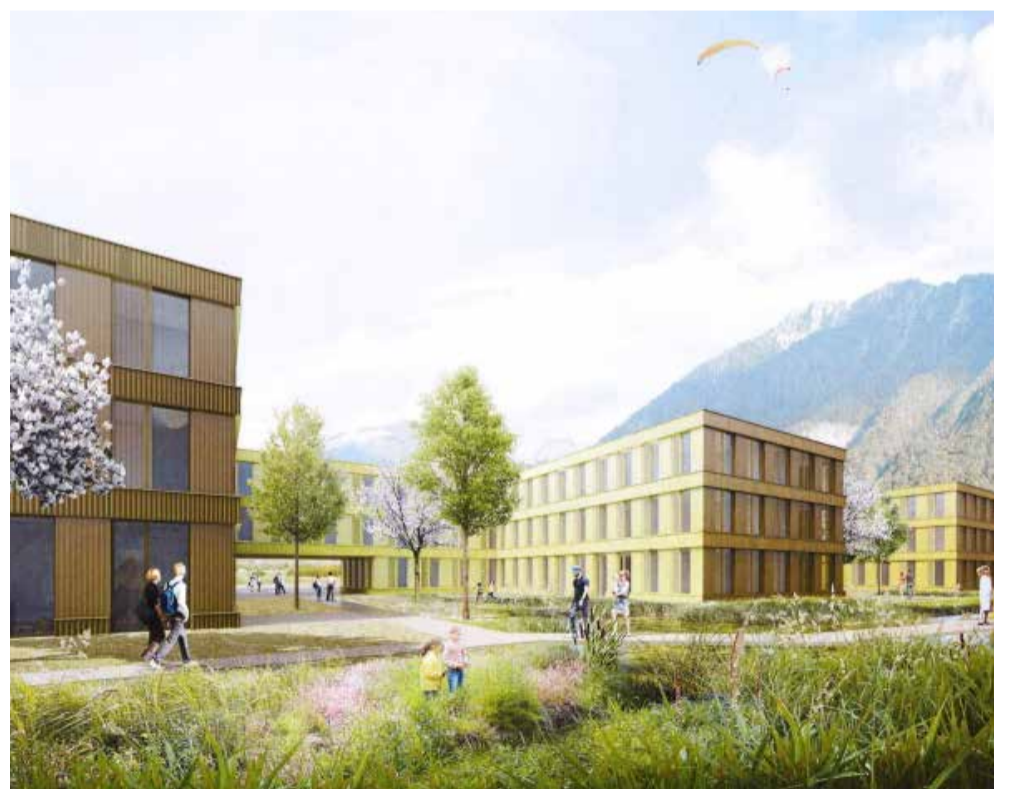
Image de synthèse du futur Espace Santé Rennaz qui ouvrira ses portes en 2018, en même temps que le site de Rennaz de l'Hôpital Riviera-Chablais.

Véritable transition architecturale entre l'Hôpital Riviera-Chablais et le village, l'Espace Santé Rennaz déploiera ses activités para-hospitalières grâce à l'investissement conjoint de la Fondation de Nant et des fondations de soutien des Hôpitaux de la Riviera et du Chablais, et celle, nouvellement créée, de l'Hôpital Riviera-Chablais.